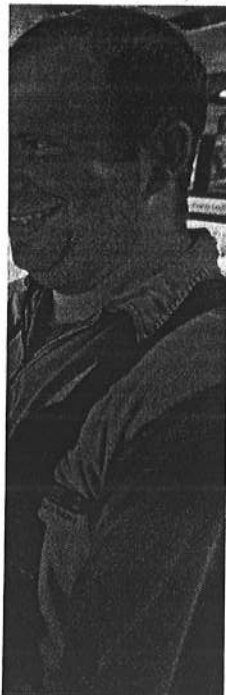
ss Nossen abgebaut. Die Ex-

Einrichtung eröffnet werden. Die Stadt Nossen hatte bereits für dieses Gebäude im Zentrum an die 400 000 Euro Fördergelder vom Freistaat Sachsen erhalten. Insgesamt wird der Ausbau an die drei Millionen Euro kosten. (SZ/DH)